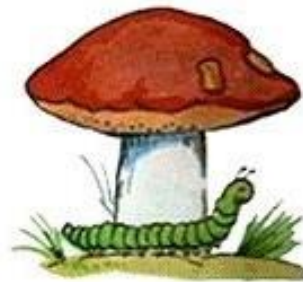
Гусеница перед грибом