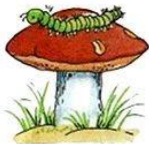
Гусеница на грибе