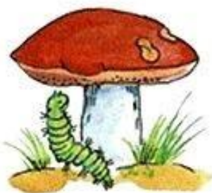
Гусеница под грибом