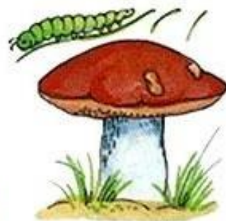
Гусеница над грибом