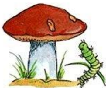
Гусеница около гриба