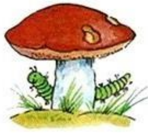
Гусеница за грибом