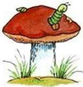
Гусеница в грибе